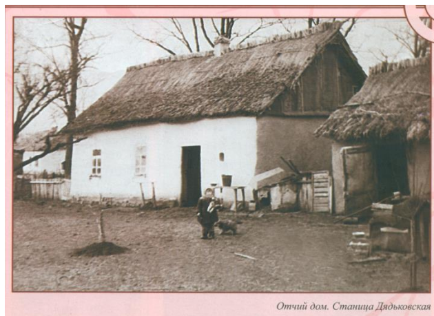
Отчий дом. Станица Дядьковская

«Сколько я себя помню, я всегда слышал народные песни. Родная Дядьковская пела с утра до вечера – и ночью тоже. Все домашние работы делали коллективно, люди жили как одна семья. Вместе месили